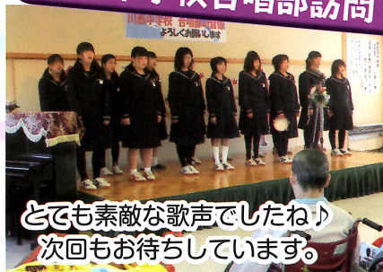
とても素敵な歌声でしたね♪ 次回もお待ちしております。