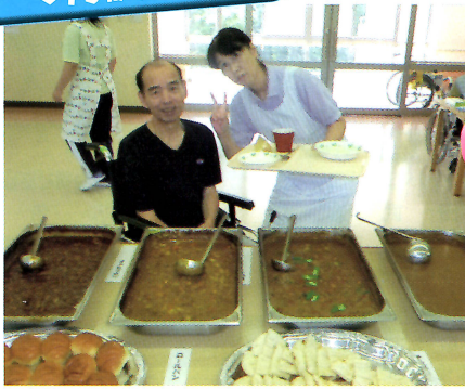
カレーバイキングをしました。 どれにしようか迷っちゃう♪