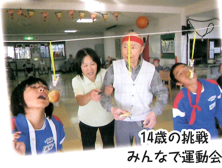
14歳の挑戦 みんなて運動会