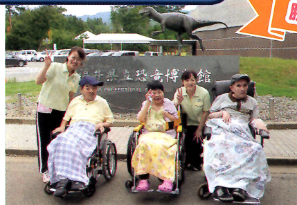
恐竜の化石が見れてよかったよ~♪