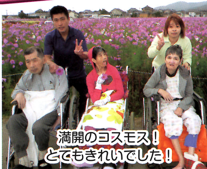
満開のコスモス! とてもきれいでした!