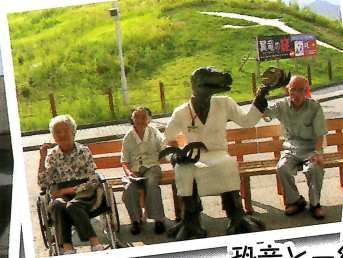
恐竜と一緒に はいポーズ!