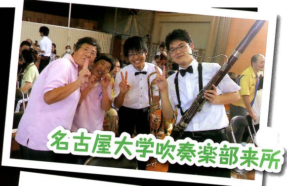
名古屋大学吹奏楽部来所