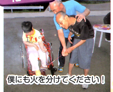
僕にも火を分けてください!