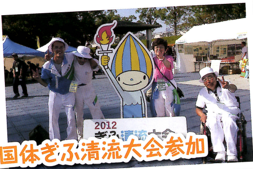
国体ぎふ清流大会参加