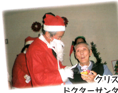
クリスマス ドクターサンタにありがとう