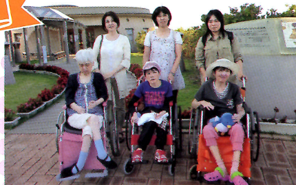
美味しい食事を食べたり、水族館へ 行ったりして楽しかったです。