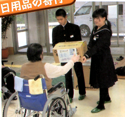
川西中学校母の会様より頂きました。 大切に使用させていただきます。