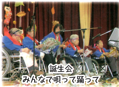
誕生会 みんなて唄って踊って