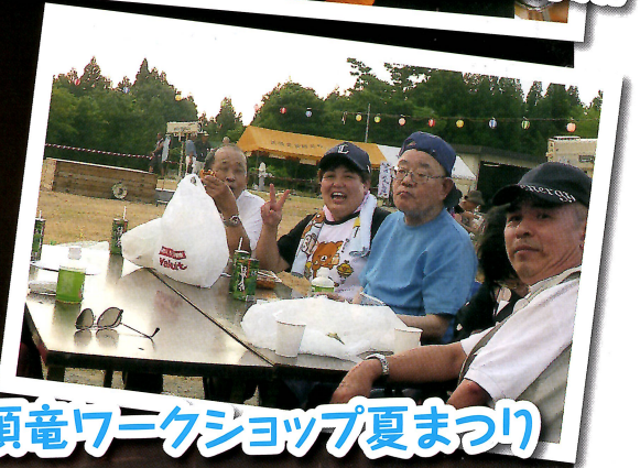
第35回九頭竜ワークショップ夏まつり