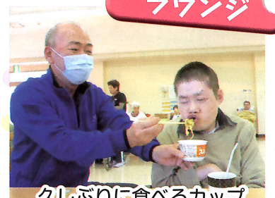
久しぶりに食べるカップ ラーメンは美味しいなあ♪